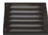
grille d'entrée d'air