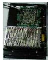
Electronique de gestion IP 03 (à placer en pied de totem)

Chaque plaque est équipée d'un capteur de température régulant l'intensité lumineuse en fonction de la température détectée afin d'accroître la fiabilité des diodes. Au delà d'un seuil de 50°, la luminosité est abaissée par sécurité. (En option : un kit de ventilation disponible si le totem n'est pas équipé)